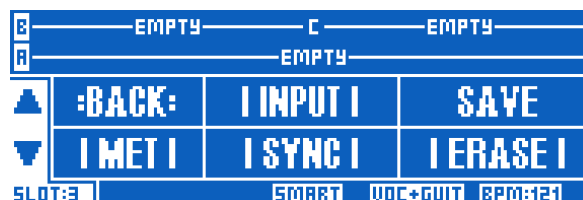
ルーパー・レイヤーの UTIL メニュー

ルーパーの録音と動作に関連する設定は、ルーパー・レイヤーの UTIL メニューに保存されます。ここでは、メトロノームのオン／オフ、メトロノーム音の選択、同期モード、ループ・インプット等といった設定が含まれます。これらの設定は、UTIL メニューから SAVE を行うことで保存できます。