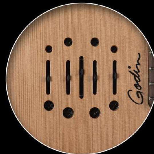
ENCORE / MUNDIAL