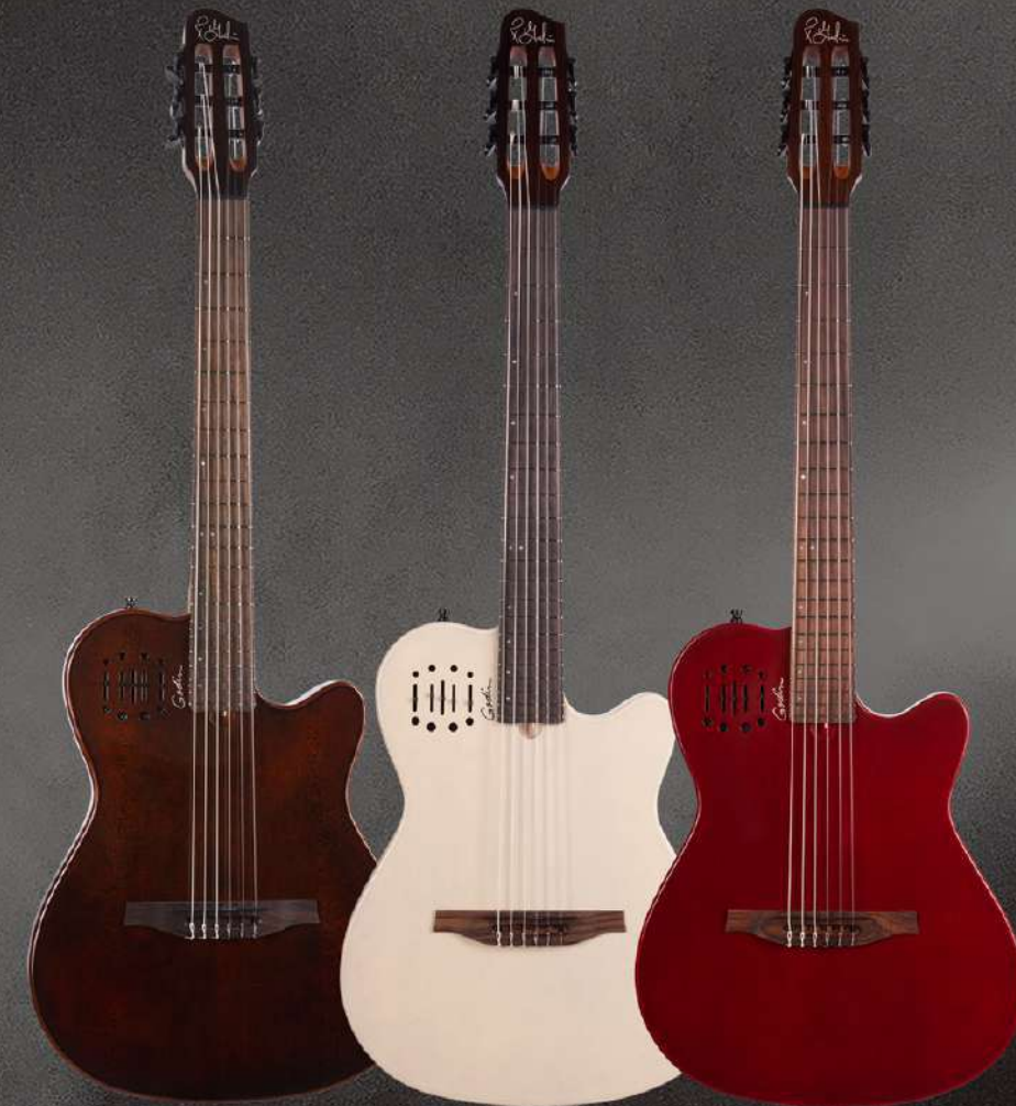
Kanyon Burst SKU: 052417 Ozark Cream SKU: 052400 Aztek Red SKU: 052394

Multiac Mundial(ムンディアル)は最近リリースされた中で最も 人気のあるモデルのひとつです。 他のMultiacをよりモダンでスタイリッシュにアレンジした このナイロンストリングギターは長年の研究開発の成果です。 ナチュラルなアンプ・ナイロン・ストリングサウンドを持つ クリーンでスッキリとした楽器をお求めの方はこれ以上のものではありません。